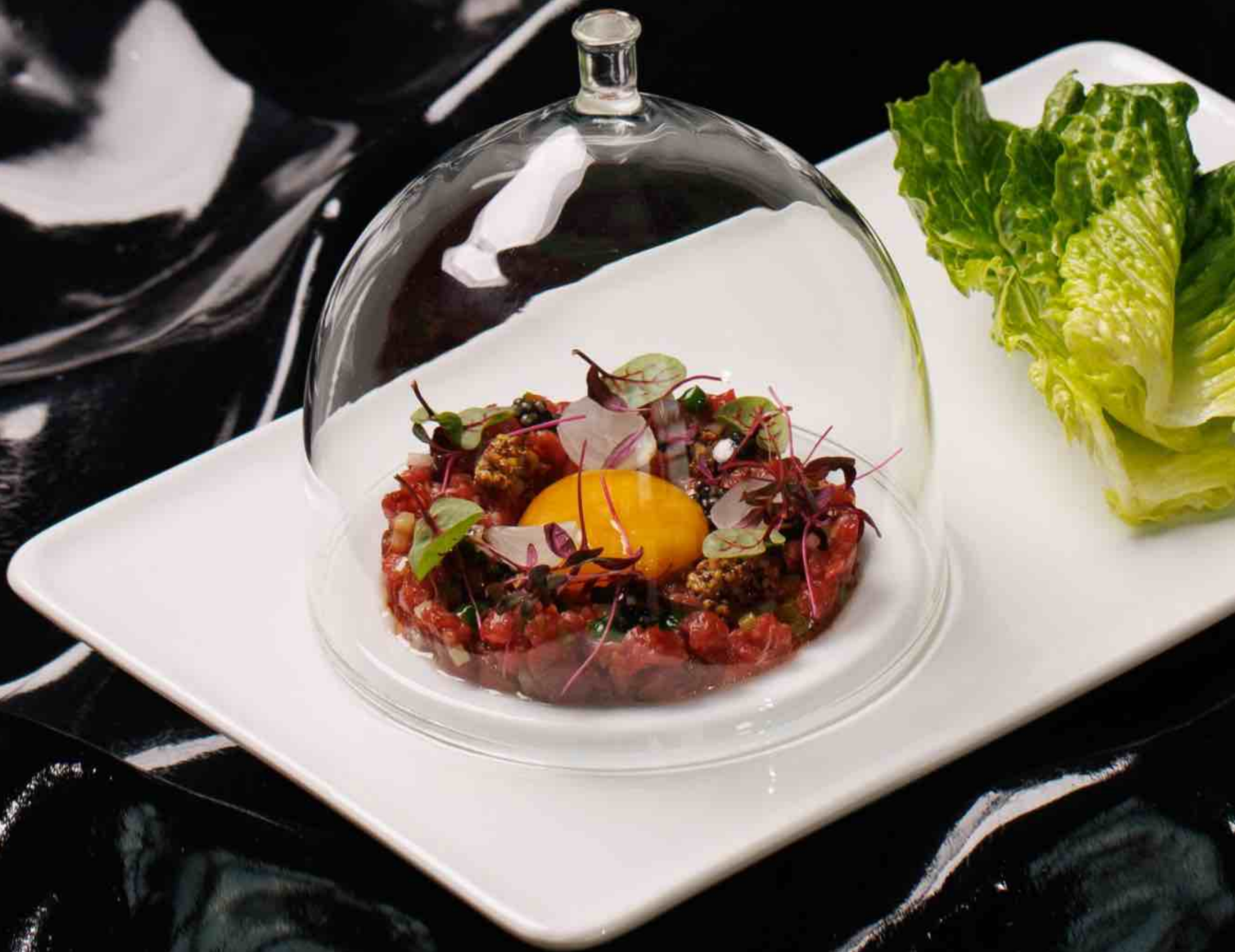
Подкопчённый тартар из говядины 230 г 1680 Чёрная икра, зёрна горчицы, жемчужный лук, томаты вяленые, соус зелёный айоли