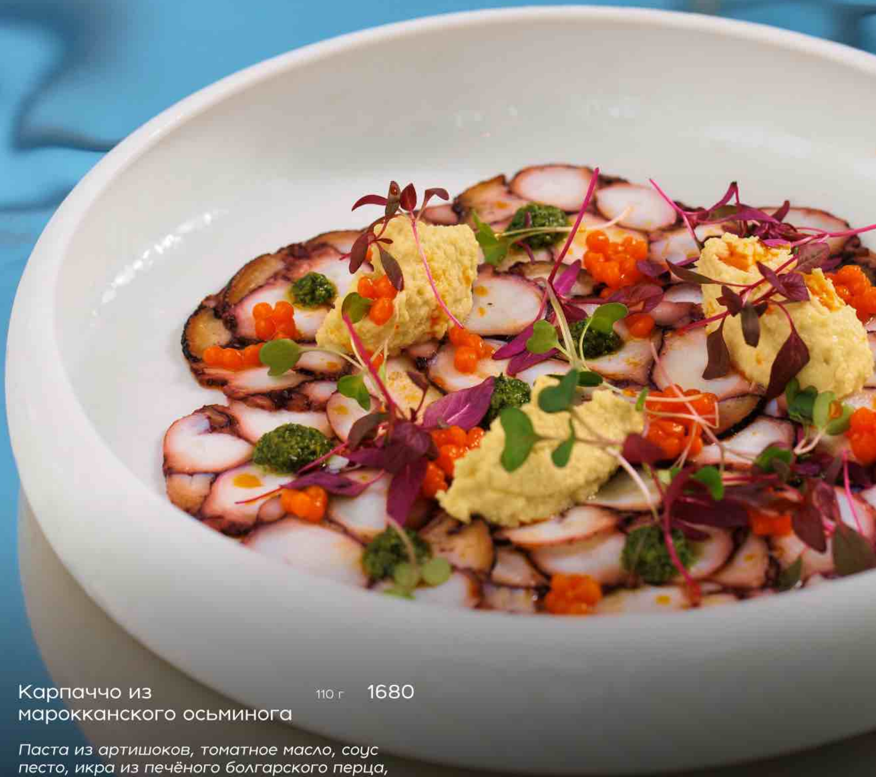
Карпаччо из марокканского осьминога