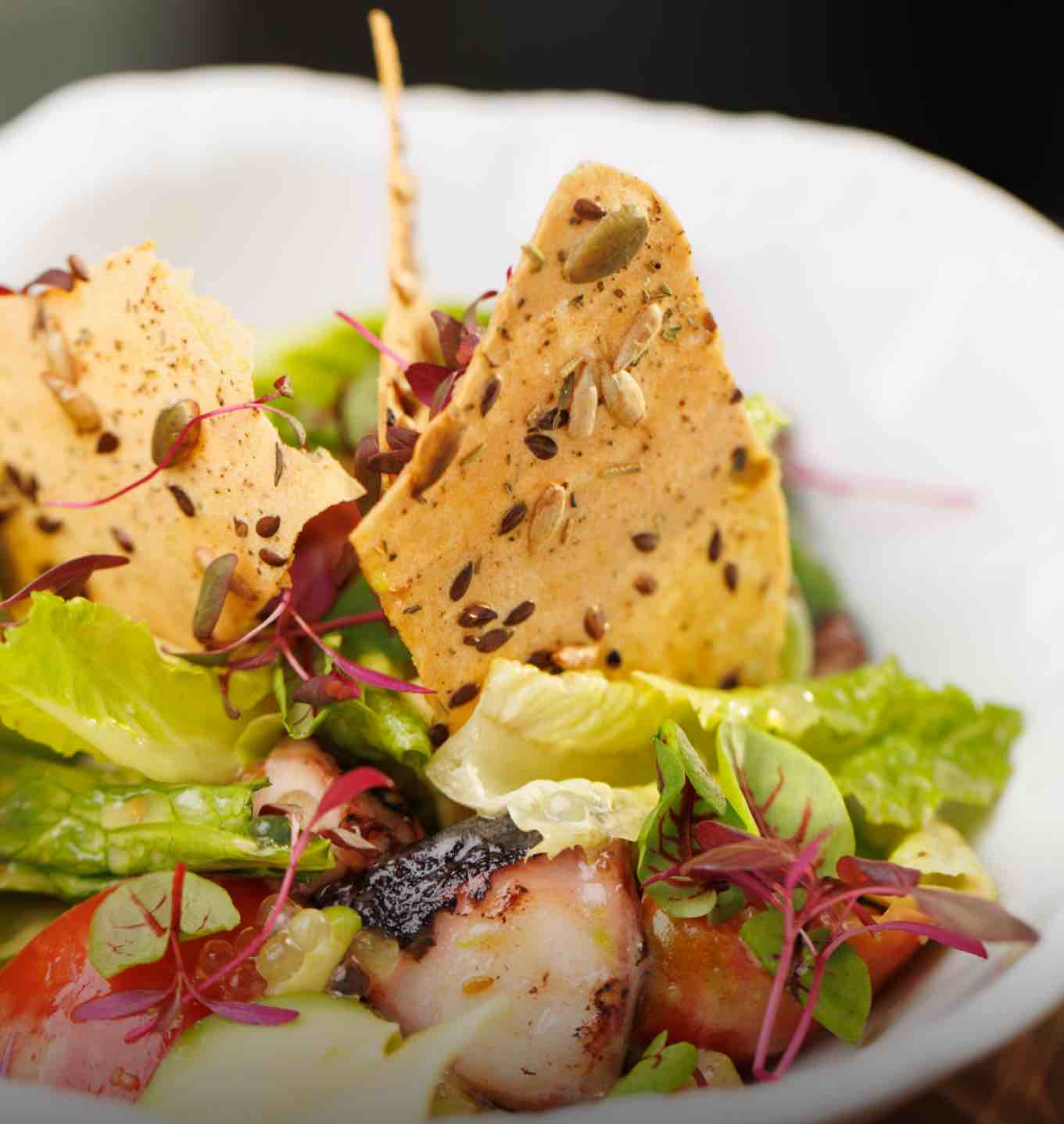
Марокканский осьминог с артишоками 220 г 1480 Сладкие томаты, авокадо, оливки, бальзамическая икра, микс салатов, злаковые чипсы