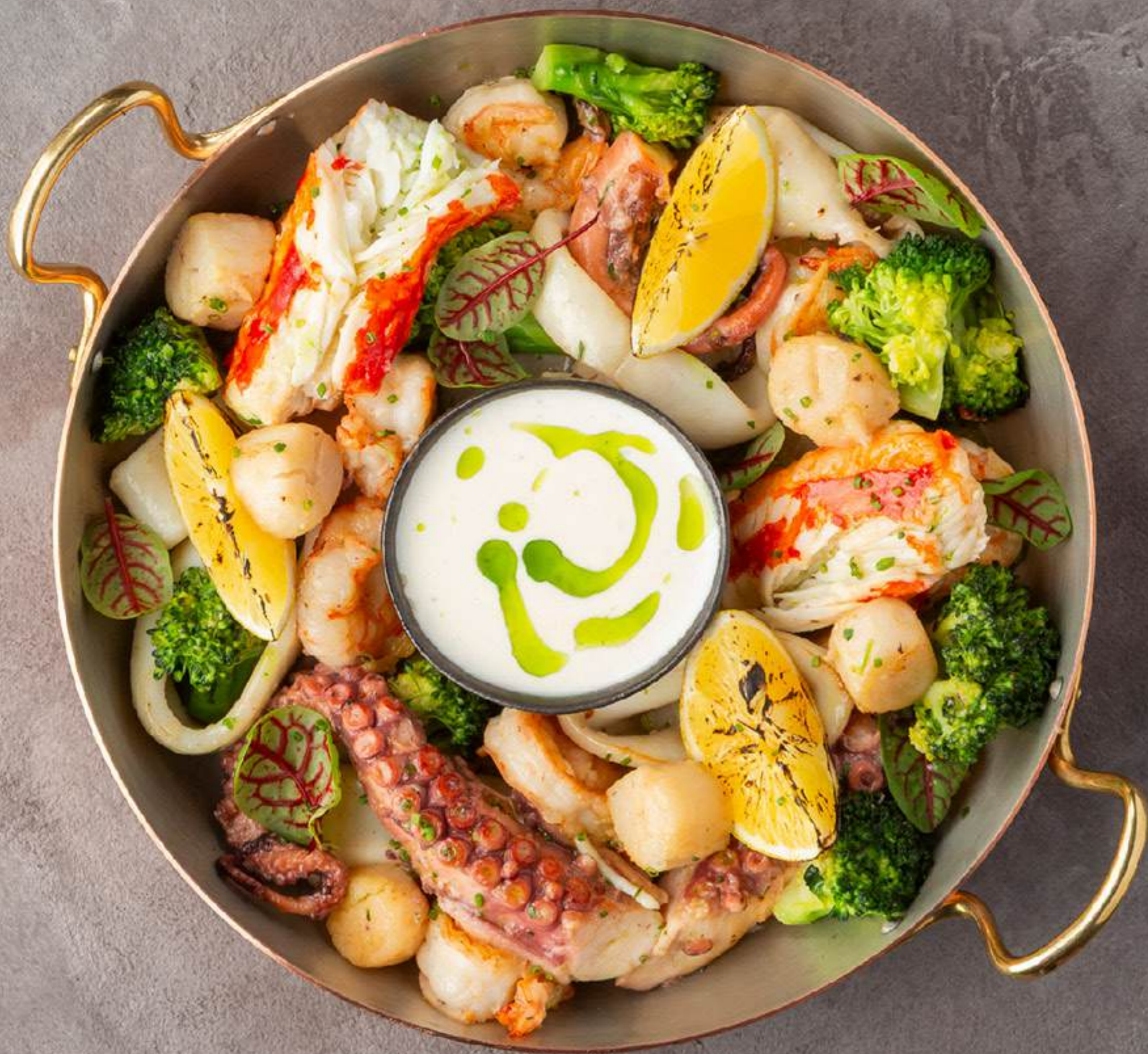
Ассорти морепродуктов 9500