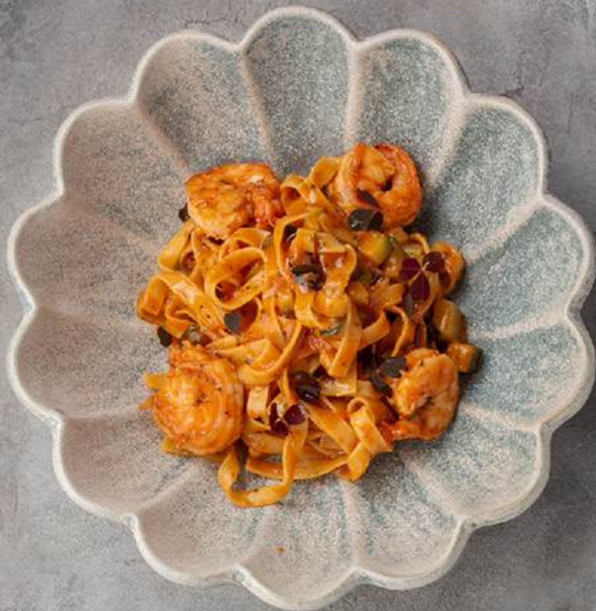
Тальятелле с креветками и цукини 1100