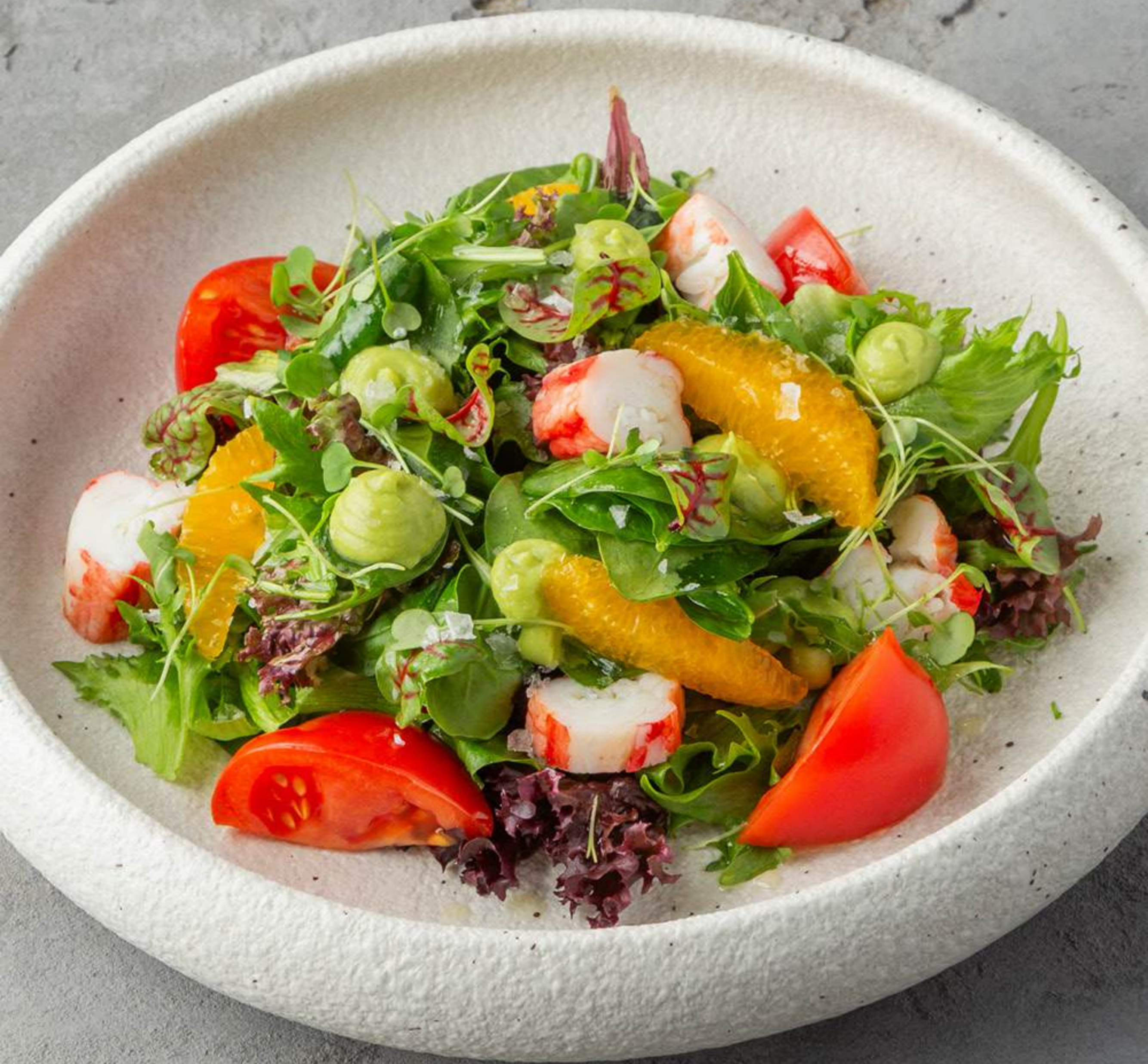
Салат с крабом и гуакамоле с томатами 1900