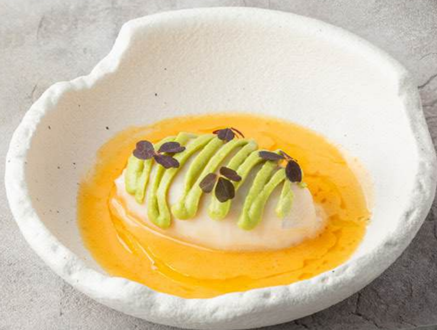
Кальмар, фаршированный сёмгой и креветками, с соусом кимчи