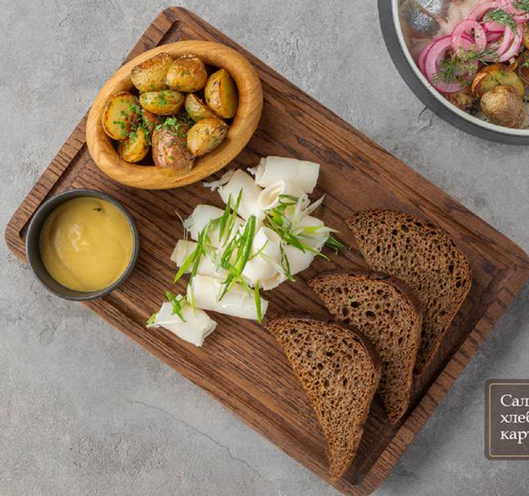
Сало с бородинским хлебом и печёным картофелем