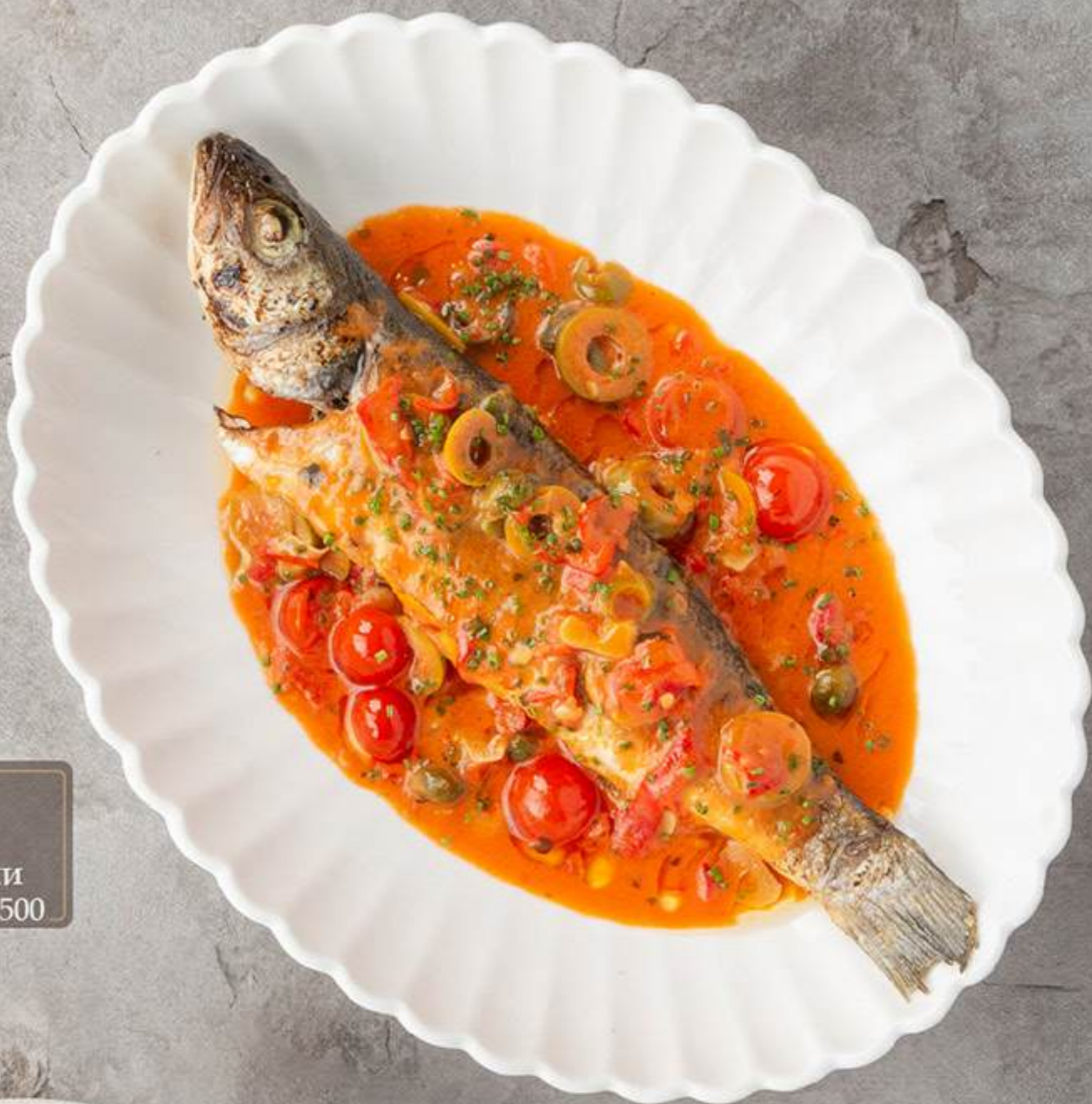
Запечённый сибас с печёным перцем, оливками и каперсами 2500