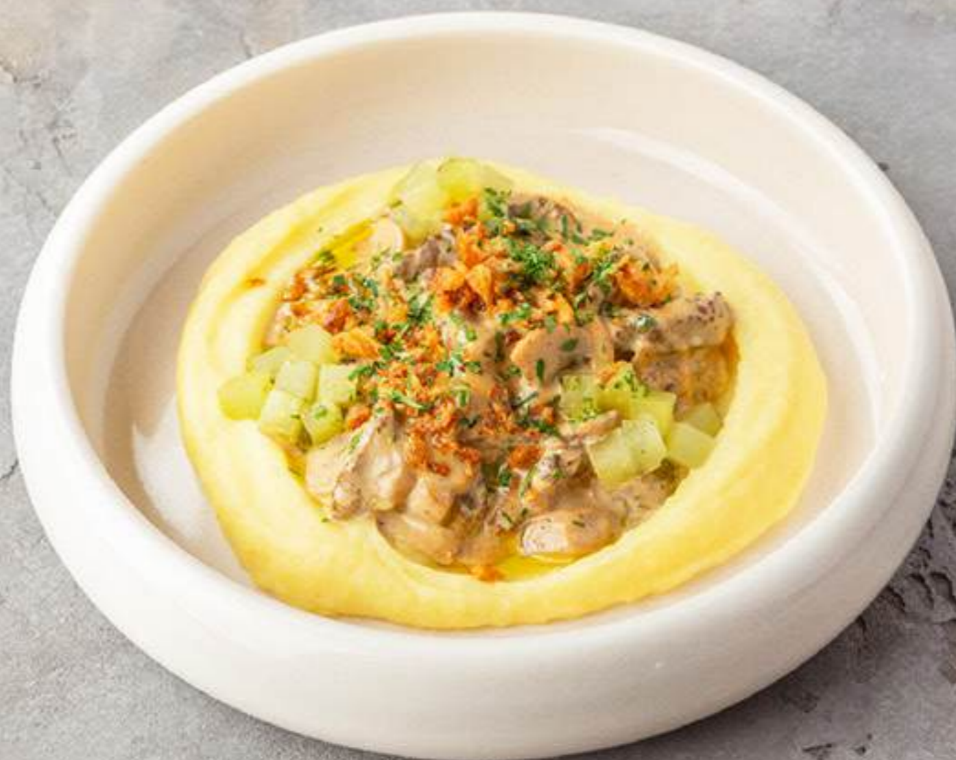
Бефстроганов из мраморной говядины 1500