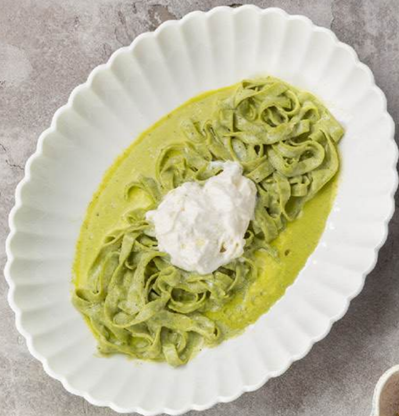
Тальятелле с соусом песто и страчателлой