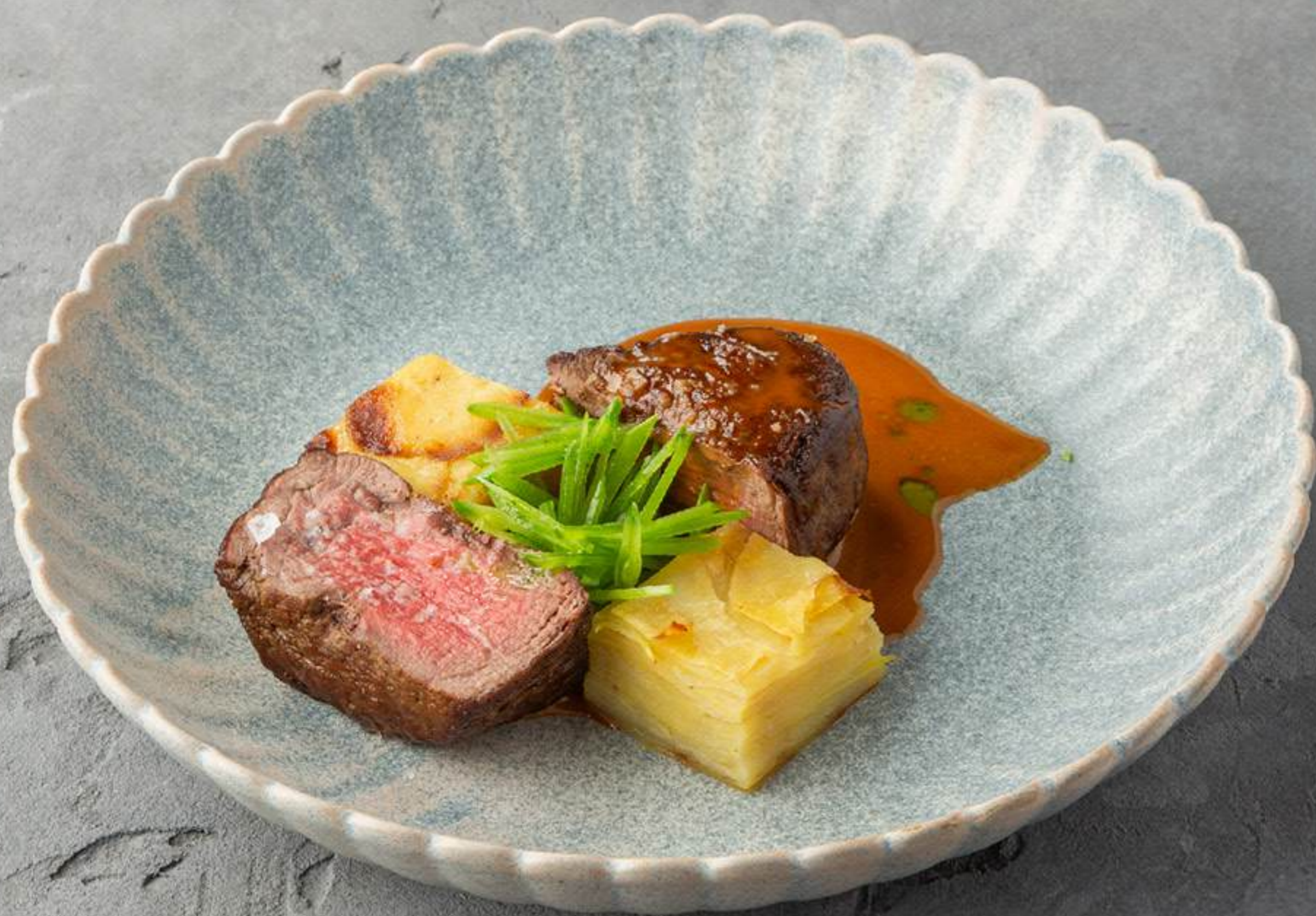
Филе миньон с картофелем конфи и трюфельным соусом