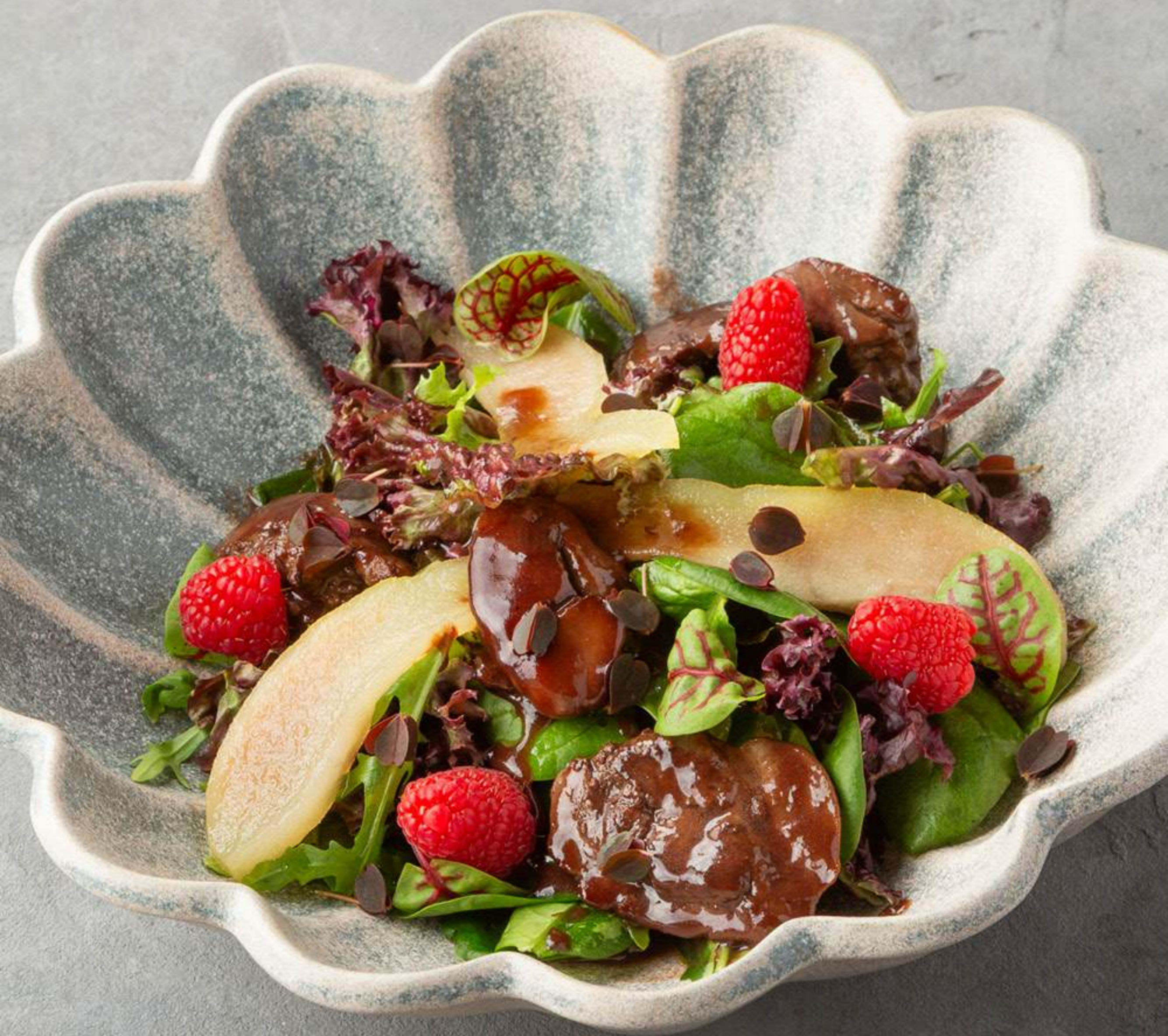
Салат с куриной печенью в малиновом соусе с пряной грушей