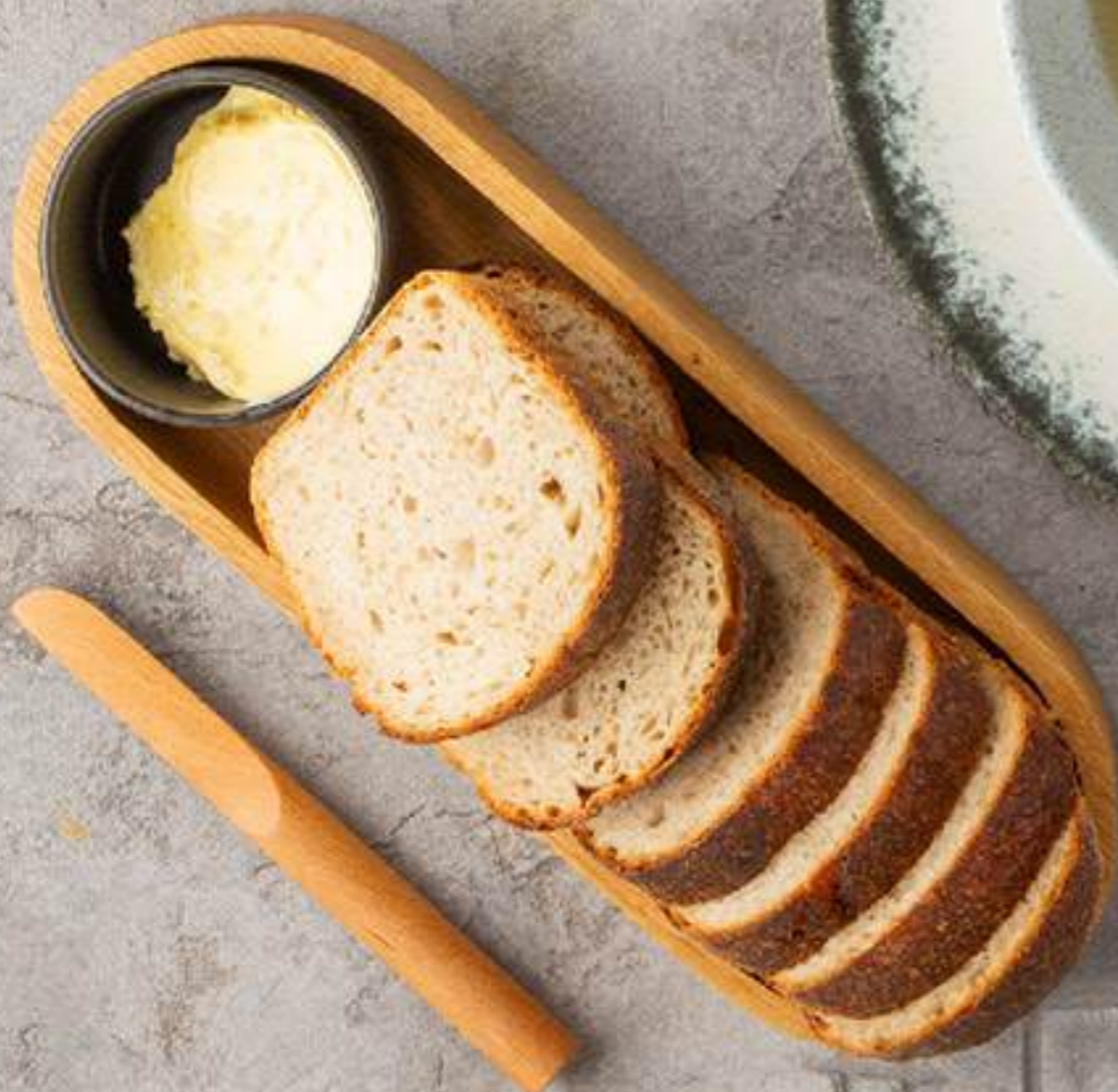
Луковый хлеб с копчёным маслом и мальдонской солью 450