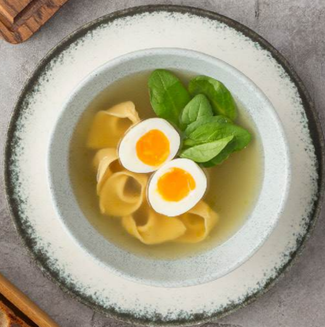
Куриный бульон с яйцом и тортеллини с цыпленком 650