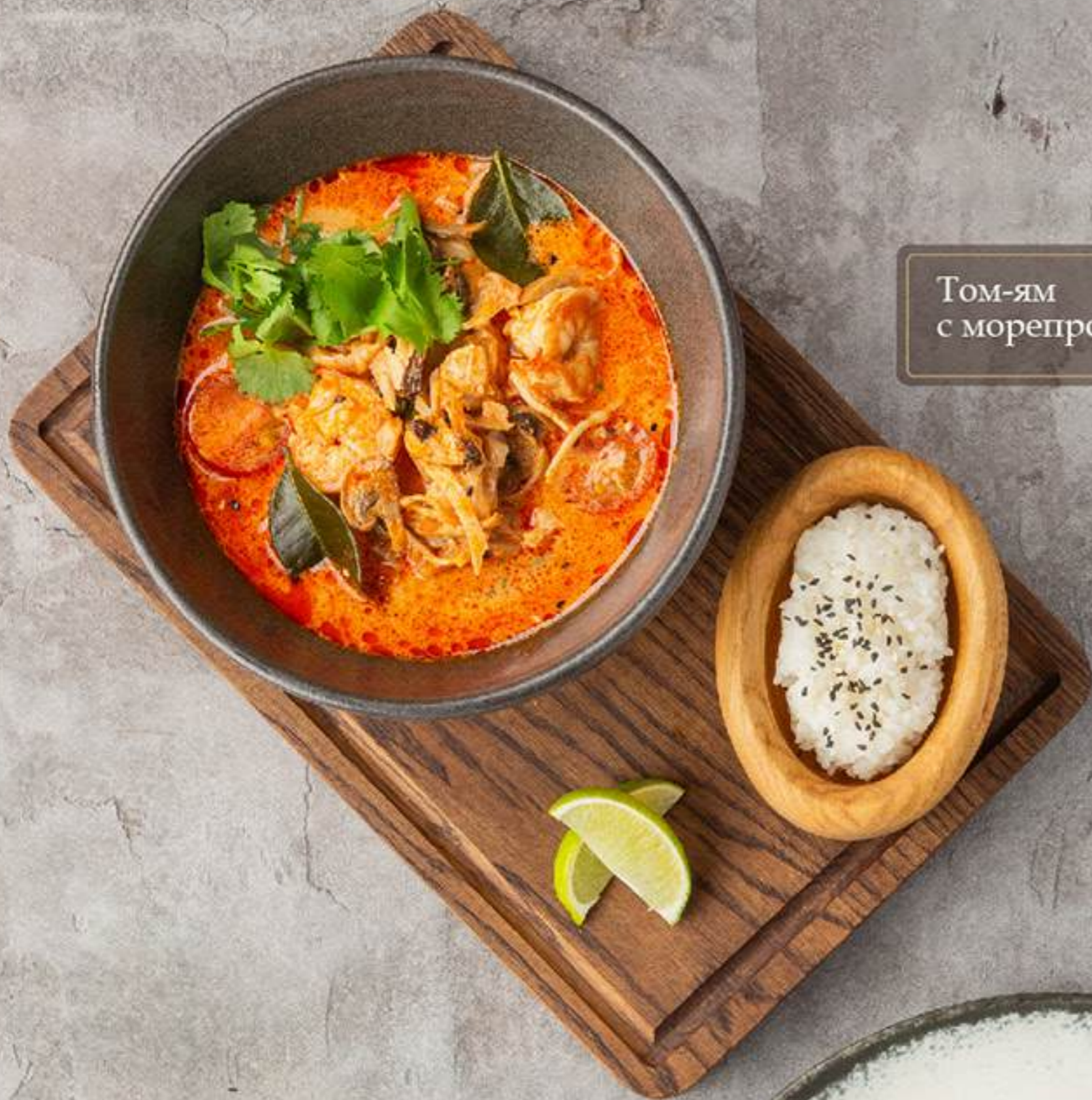
Том-ям с морепродуктами 1200