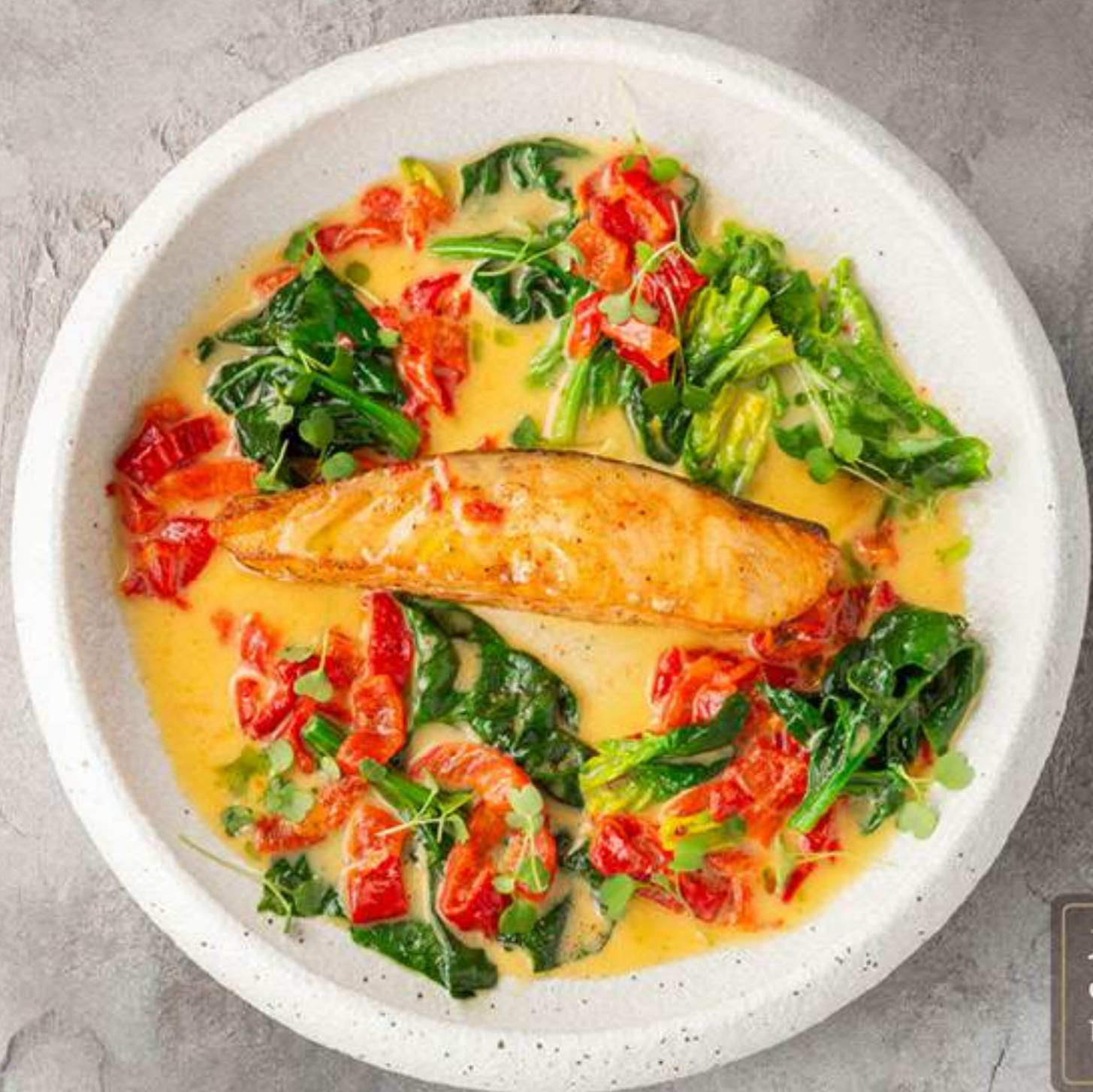
Лосось в соусе берблан со шпинатом и перцем рамиро 2300