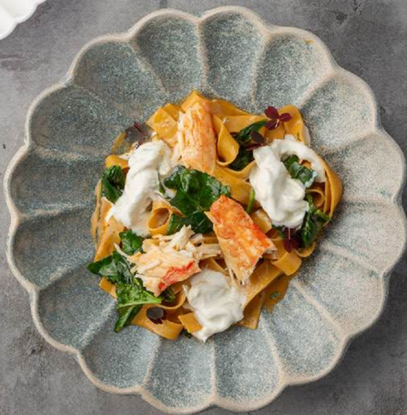
Феттучини с крабом и страчателлой 2800