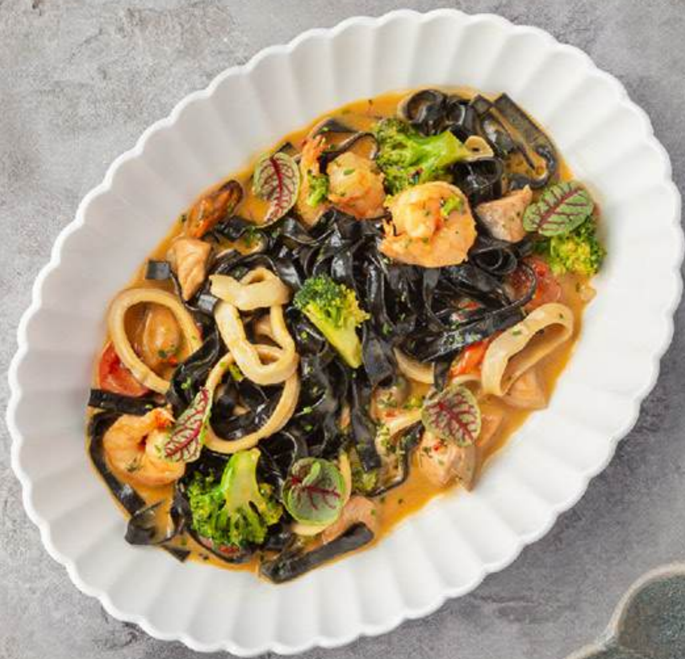
Тальятелле с морепродуктами ХИТ 1700