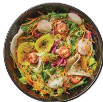
Салат с водорослями

Водоросли комбу, вакаме, тосака, салат кайсо, редис, огурец, морковь, орехово-соевая заправка, кунжут