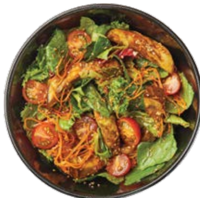
Салат с баклажанами

Микс салатов, баклажаны на пару в соусе чили, имбирная заправка, томаты черри, пряная морковь, кунжут