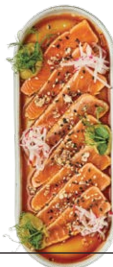
Татаки из тунца

Опаленный тунец, авокадо, редис, соево-кунжутное масло, мусс из шпината и чуки