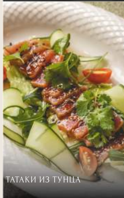
ТАТАКИ ИЗ ТУНЦА

с авокадо, творожным кремом и зеленым маслом, подается с хрустящей чиабаттой / 100/90 гр