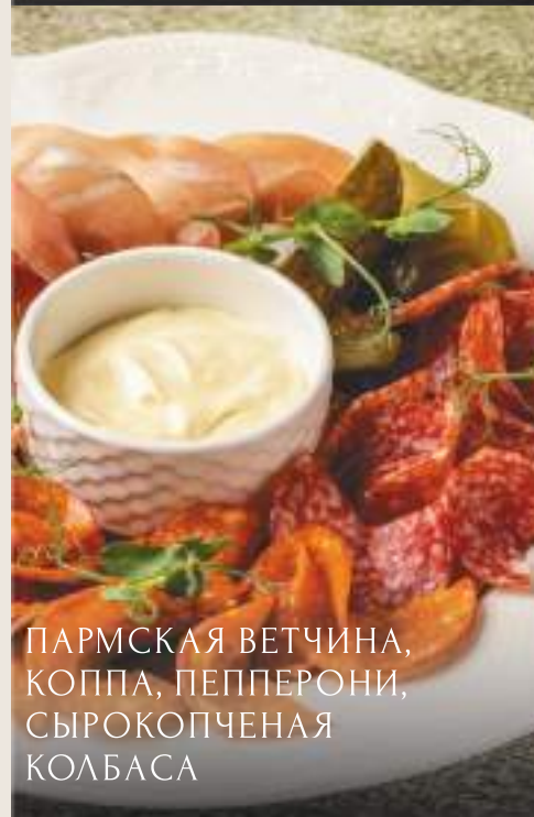
ПАРМСКАЯ ВЕТЧИНА, КОППА, ПЕППЕРОНИ, СЫРОКОПЧЕНАЯ КОЛБАСА