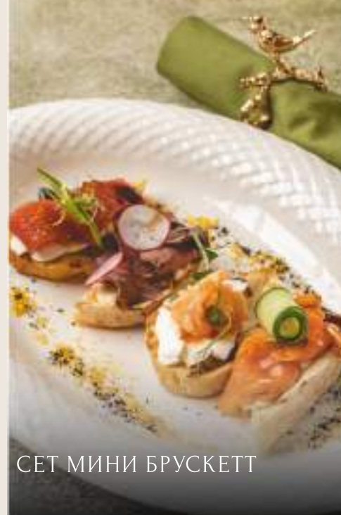
СЕТ МИНИ БРУСКЕТТ

с форелью и кремом унаги, с креветкой свит-чили и крем чизом, с ростбифом и горчичным соусом, с тунцом в кунжутной глазури / 170 гр