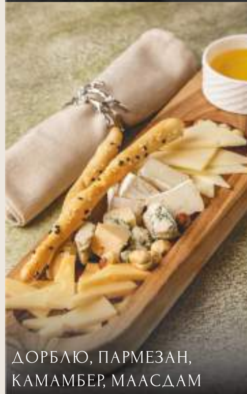
ДОРБЛЮ, ПАРМЕЗАН, КАМАМБЕР, МААСДАМ