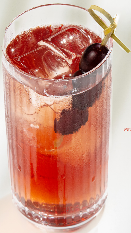
NEW Uva non/alco Ува б/алко вермут б/а, кордиал виноград-жасмин, тоник, жасминовый чай 440