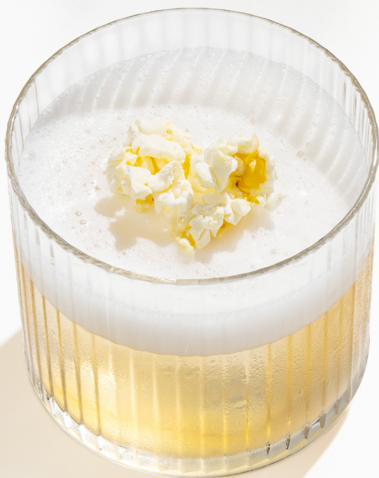
NEW Corn non/alco Корн б/алко виски б/а, кордиал попкорн, кордиал липа, попкорн, лимонный сок 420